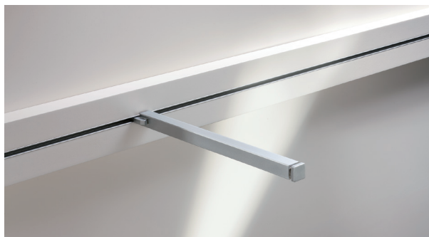
Einbau mit Aufsatzprofilen Top-mounted profile