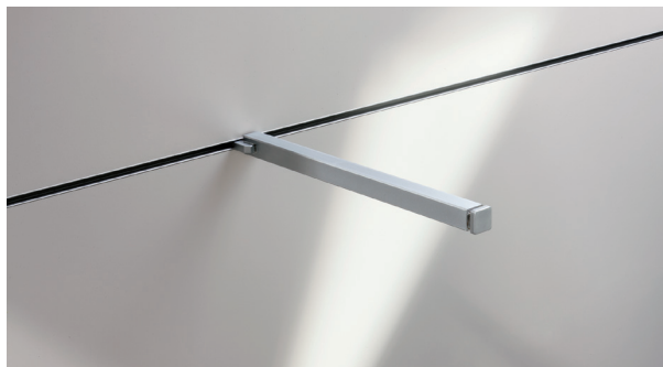
Einbau mit Rückwandprofilen Flush-mounted profile